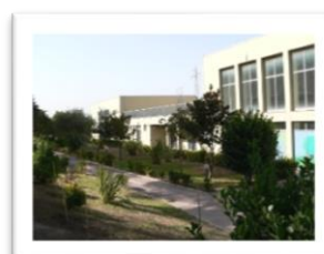
Sede di Albuccione