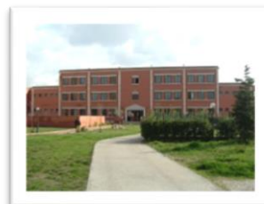
Sede di Colle Fiorito